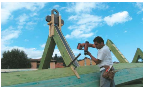
Fasi di completamento degli archi Legnoforma® e fissaggio dei ganci di sollevamento.