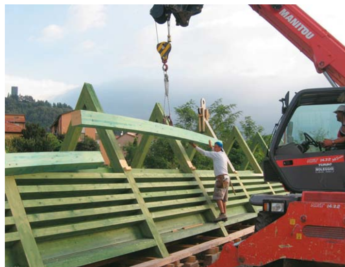
Nella pagina precedente l'impermeabilizzazione interna con tessuto di vetro E ed adesivo Xepox 14 (sistema Polyevery®). In questa pagina la ricomposizione degli archi con la tecnica di riassetto cantieristico Traveforma®.

La passerella in legno dell'ACSM ha consentito di verificare la reale possibilità di formare a piè d'opera o in opera delle grandi strutture lignee, anche curvilinee, composte da tanti piccoli elementi in legno. La tecnica è applicabile tanto al legno massiccio, quanto al legno lamellare, nell'ambito delle proprie peculiarità o limitazioni. Basti pensare alla convenienza di ricomporre elementi lignei di grande dimensione e portata, di qualsiasi forma e per qualsiasi articolazione strutturale, anche in zone disagiate, ricorrendo a mezzi di trasporto e mezzi d'opera limitati. È sufficiente approntare in stabilimento o in segheria una corretta produzione di piccoli pezzi a casellario e poi assemblarli facilmente a piè d'opera o in opera con l'impiego di adesivo Unixepox e viti per il pressaggio. È del tutto ovvio che la passerella di Como avrebbe potuto essere costruita con due semplici archi lamellari o tutt'al più con quattro semiarchi: ACSM è stata determinata nel sostenere un'idea di progresso, assumendo nello specifico il ruolo di eccellenza per la ricerca. Nel progetto iniziale i corsi lignei avrebbero dovuto avere i colori dell'arcobaleno. Quando è stato costituito il movimento, sono stati semplicemente sostituiti i colori, perché le diatribe politiche non soffocassero aspetti che dovevano restare strettamente tecnici. La forza di ACSM è stata quella di guardare alla sostanza.