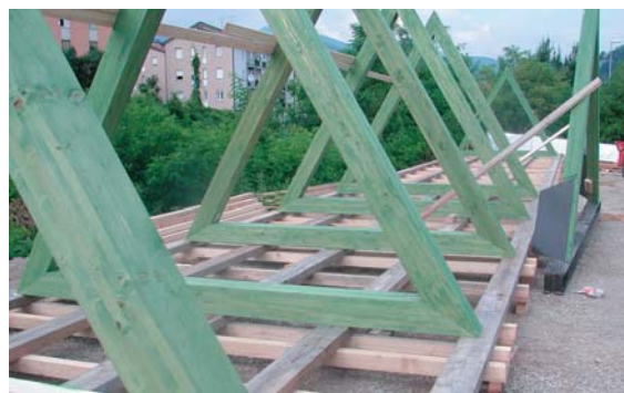
Istruzioni, impostazione ed avvio dei lavori, raccomandazioni.